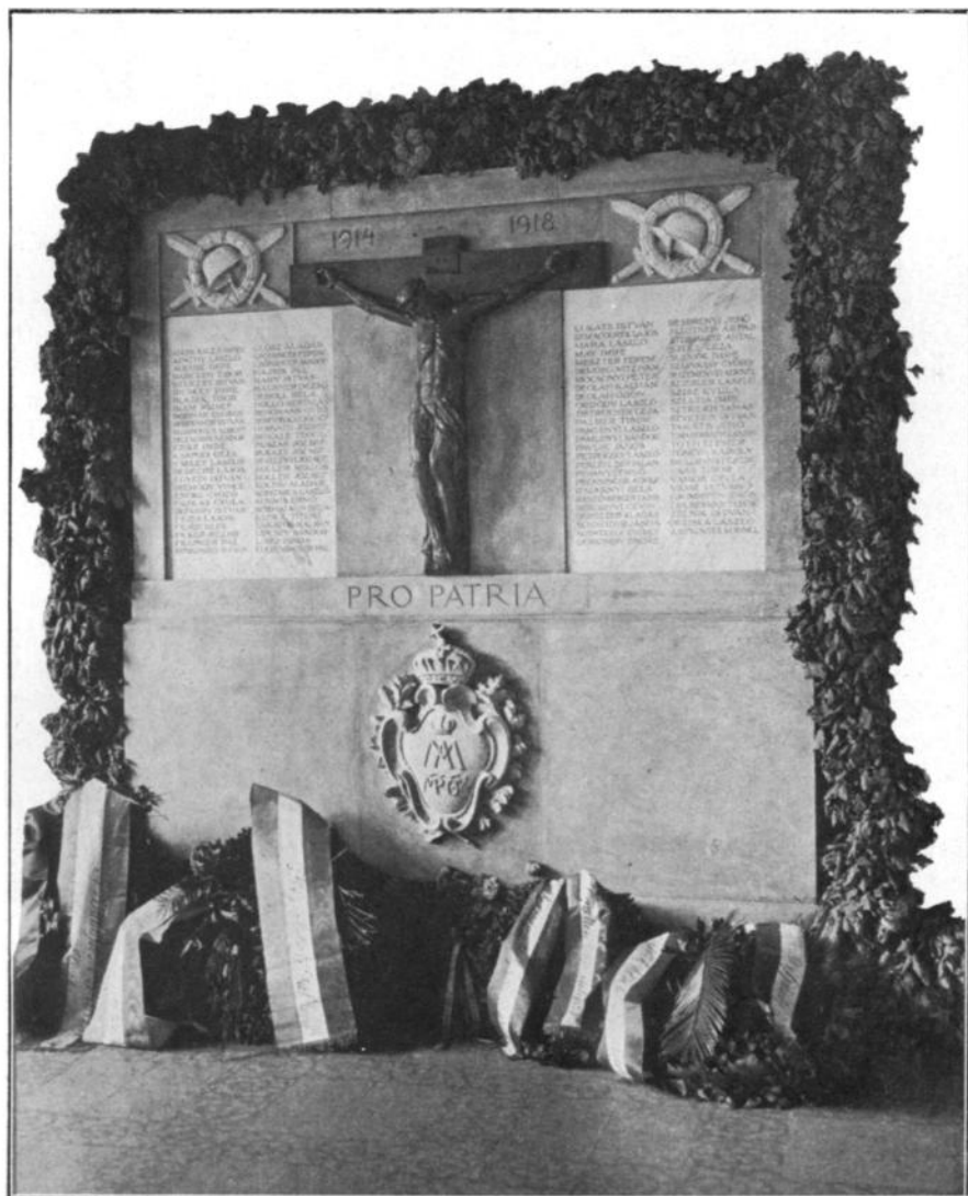
A HŐSÖK EMLÉKMŰVE.