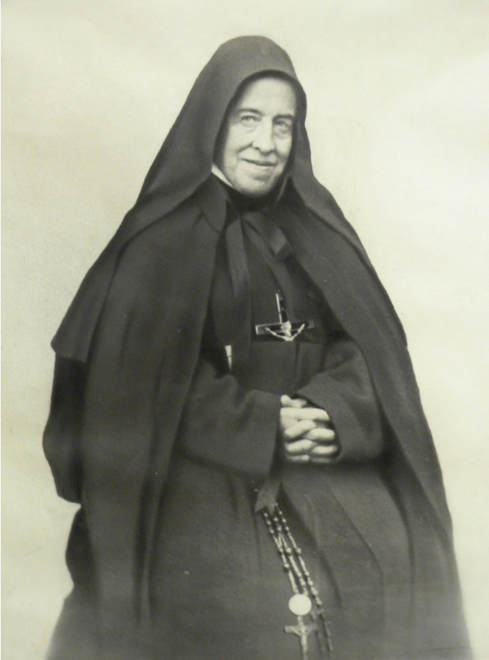
Az alapító anyja, piarista reverendában

Hosszú keresés eredményeképpen találtak egy kisebb kastélyt a viale Michelangelón. Villa Margheritának nevezték, és a kastély tökéletesen megfelelt az új pedagógiai elvárásoknak.