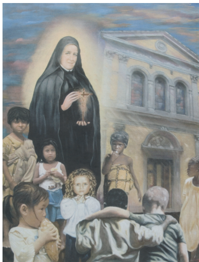
Celestina anya a boldoggá avatásra készült plakáton