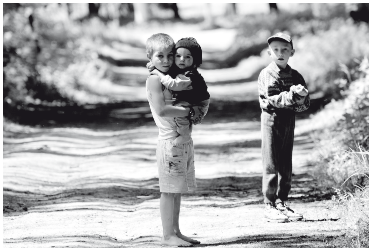
Elhagyott gyerekek Romániában