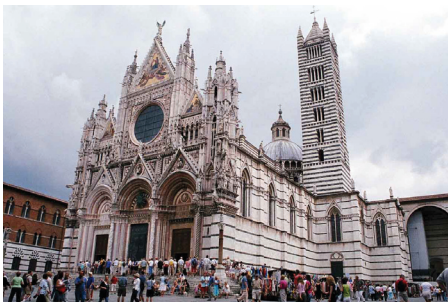
A sienai dóm

Levelet írt Mauro Riccinek, a piaristák generálisának 13 , hogy kérje meg a pápát a kinevezés visszavonására. Ugyanezt kérte Corso bátyjától, aki az egyház jogainak bátor védelmezője volt, és ezért XIII. Leó pápa nagyra becsülte.