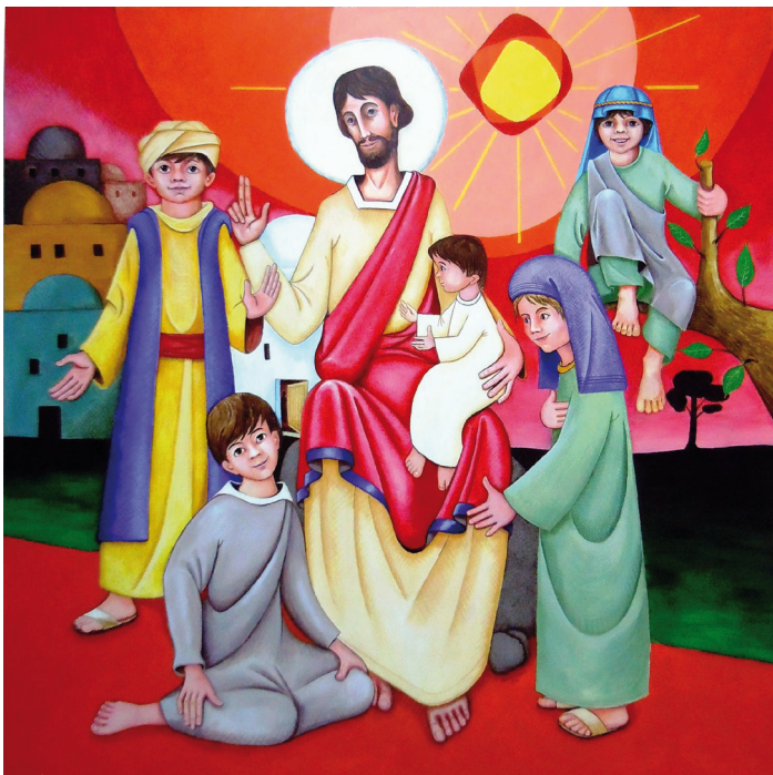
A gyerekeket hívó Jézus; Javier Agudo piarista festménye Getafében (2011)

tett az érzésük, hogy nincs semmi földi ebben a teremtményben. Lelke olyannyira egybeforrt és elmerült Istenben, hogy a közelében lévő embereket is nemesebbé tette. Egy gondolat hatotta át összes levelét: Jézus és mindig csak Jézus mindenben.”