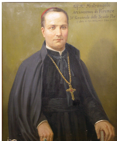
Alfonso Mistrangelo érsek (1852–1930)

Bausa bíborost hónapokkal később egy piarista érsek, Alfonso Mistrangelo követte a firenzei egyházmegye élén. Celestina anyja Pontremoliba sietett, hogy meglátogassa, Mistrangelo ugyanis előbb ennek az egyházmegyének volt a püspöke. A piarista nővérek nagyon örültek. Az új érsek, akit hamarosan bíborossá is kreáltak 20 , 1899. december 17-én történt beiktatása után szinte azonnal meglátogatta őket. Mistrangelo 1852-ben született, és 1930-ban bekövetkezett haláláig ő vezette az egyházmegyét. A nővérekre igazi testvérként tekintett, és az egyházmegye pásztoraként, valamint a piarista rend általános elöljárójaként és vizitátoraként 21 – ez utóbbi feladattal XIII. Leó, majd X. Pius pápa bízta meg – segítséget nyújtott nekik, és mindig nagy szeretettel tanúsított irántuk.