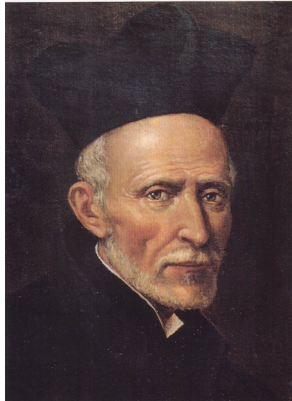
Kalazanci Szent József (1557–1648)