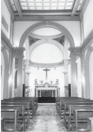
A San Giuliano-templom belseje