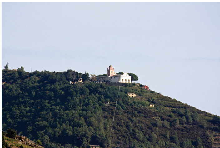
A montenerói Mária-kegyhely