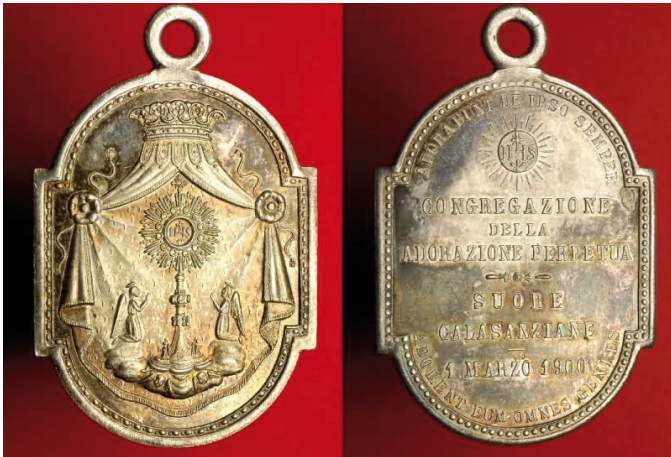
A szentségimádó lányok társaságának medálja 1900-ból

Így hát Celestina anya a megtanult leckét átültette a gyakorlatba is, és 1900. március elsején elindította a folyamatos szentségimádást a via Ghibellinán, vagyis a Szent Bernát-templomban. Mindebben a közösség káplánja, Bonaventura Calamecca atya örömmel volt segítségére. Olaszországban valószínűleg egyedülálló kezdeményezéssel állunk itt szemben. Hamarosan megalakult a szentségimádó lányok társasága, amely nem sokára már több mint száz tagot számlált azokból a lányokból, akik a piarista nővérek védencei voltak.