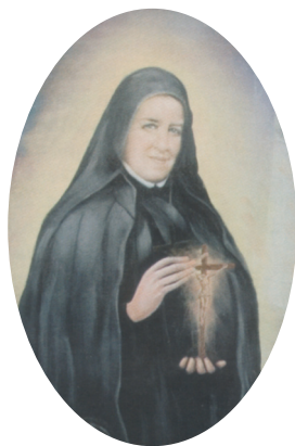
Celestina anya (1848–1925)

2008 márciusának utolsó vasárnapján délután zsúfolásig megtelt a firenzei dóm. A belépő látogatóknak feltűnhetett, hogy bár nem ifjúsági szentmisére gyülekeztek a hívők, mégis nagyon sok kisgyermek volt jelen. A szemlélő azt azonban már nem tudhatta, hogy ezek legtöbbször olyan kis árva, akik talán nem is ismerték édesanyjukat és édesapjukat, vagy valamiért elkerültek a családi házból, mert szüleik különféle okok miatt nem tudtak gondoskodni róluk.