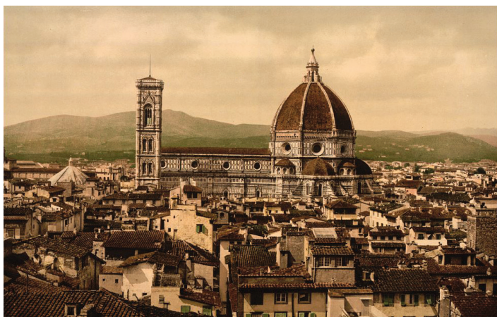
A firenzei dóm (1890 körül)

Tanulmányait mindig kitűnő eredménnyel végezte. Grammatikát, matematikát, történelmet és filozófiát tanított a sienai, urbinói, castiglionei, majd a firenzei piarista iskolában. Képes volt a nevelés apostoli munkáját a betegek és szegények iránti irgalmas törődéssel egyesíteni. Annak érdekében, hogy biztosíthassa és bővíthesse a kalazanciusi életeszményt a katolikus laikusok, főként a tanítók és tanítónők körében, megalapította a tiszteletreméltó piarista harmadrendet 7 . Mély teológiai és kánonjogi ismereteivel kiérdemelte, hogy a Firenzéhez közeli fiesolei egyházmegyében teológiai szakértővé nevezzék ki. A piarista renden belül a San Giovannino piarista közösség házfőnöke, a firenzei piarista iskola igazgatója, a szerzetesnövendékek oktatója és nevelője volt, 1874 és 1889 között pedig tizenöt nehéz éven át a toscanai rendtartomány főnökeként tevékenykedett.