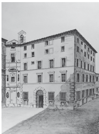
A San Pantaleo-rendház bejárata