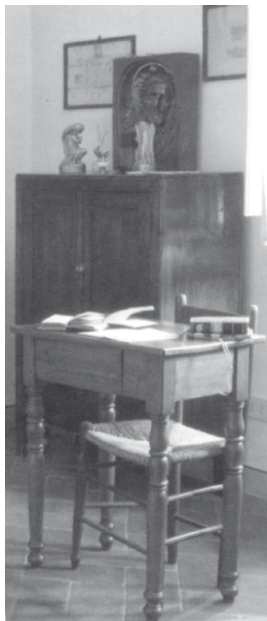
Celestina anyja íróasztala