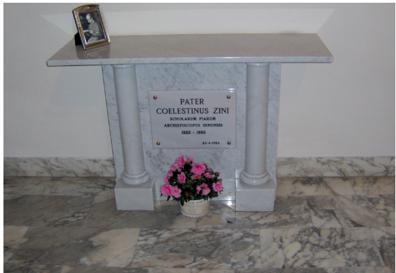
Celestino Zini síremléke