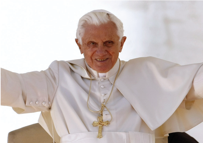
XVI. Benedek pápa