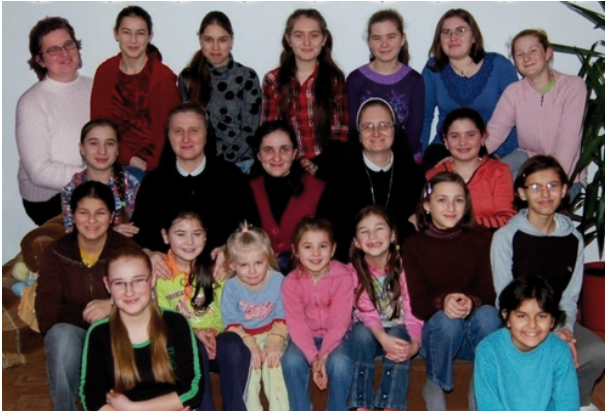
A nagykárolyi magyar piarista nővérek, gyermekekkel