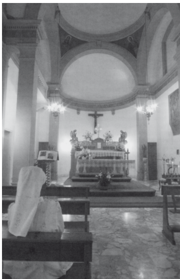
A szentségimádás ma is folyamatos

1925. március elsején ugyancsak Mistrangelo bíboros mondta a szentmisét a San Giuliano-templomban, amikor a folyamatos szentségimádás megkezdésének huszonötödik évfordulóját ünnepelték. Celestina anyja örült, de nagyon csöndesnek és kissé visszahúzódnak mutatkozott. Suttogva vallotta be: „Nem érzem jól magam.”