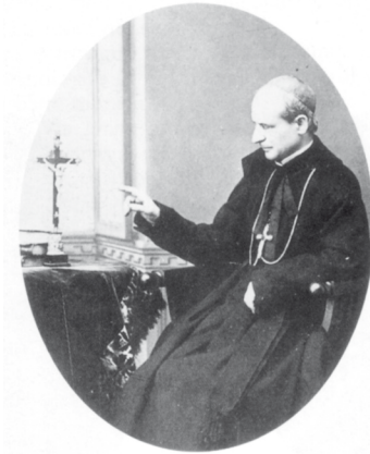
Celestino Zini (1825–1892)

1892. május 7-én villámcsapásként érte a hír a via Faenza lakóit: Zini atya súlyos beteg. Kánoni látogatása ( visitatio canonica ) 17 során rendkívül kimerültnek érezte magát, egyik vidéki plébániájának látogatása során pedig magas láz gyötörte. Az orvos megparancsolta neki, hogy vonuljon vissza azonnal palotájába, és maradjon ágyban. Celestina anyja nyomban Sienába szeretett volna utazni, az orvos azonban minden látogatást szigorúan megtiltott. A beteg érsek pedig biztos volt abban, hogy meghal: „Én beveszem az összes gyógyszert, amit csak akartok, de ugyanannyit érnek, mint olajat önteni abba a lámpásba, amelynek már elégett a kanóca.”