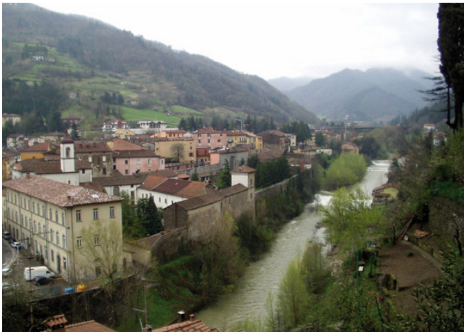
Marradi, Celestina anya szülőfaluja

A 19. században Marradi egy kedves, kis település volt Firenze és Faenza között félúton. A Lamone folyó partján termékeny talajra épült, és kiváló borairól volt nevezetes. Talán még most is csak ezekről lenne híres, ha nem született volna ott egy szent.