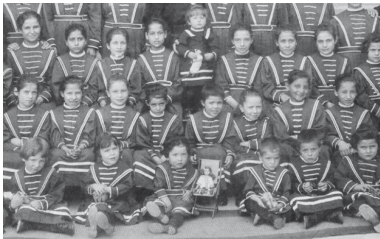
A piarista nővérek lányai egy 1920-ban készült fényképen