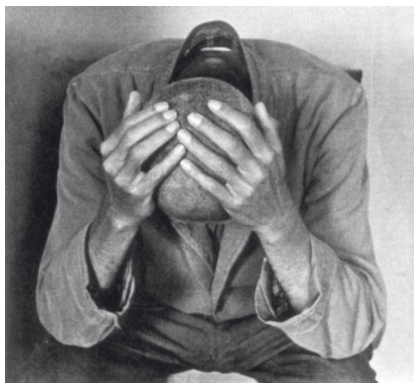
Egy apa a börtönben (illusztráció)