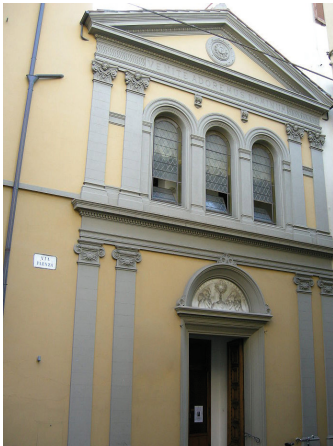
A San Giuliano-templom homlokzata