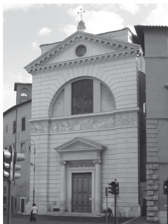
A San Pantaleo-templom homlokzata

Mindez pontosan be is következik: a második rend, az intézmény megalapítása, a szabályzat, és még az új San Pantaleo is a via Faenzán.