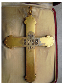
A bíboros mellkeresztje

Testét felravatalozták, három napig nyilvánosan látogatható volt, először egy a kapu mellett álló teremben, majd pedig a San Giuliano-templomban. Itt tartotta gyászbeszédét Giovanni-ozzi atya. Emberek özöne látogatta a kis kápolnát, minden